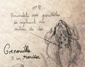
Grenouille rousse 9 cm

Borocèles non parallèles se repliant au milieu du dos