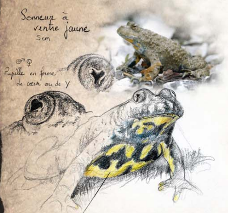
Scoteanax à ventre jaune 5 cm