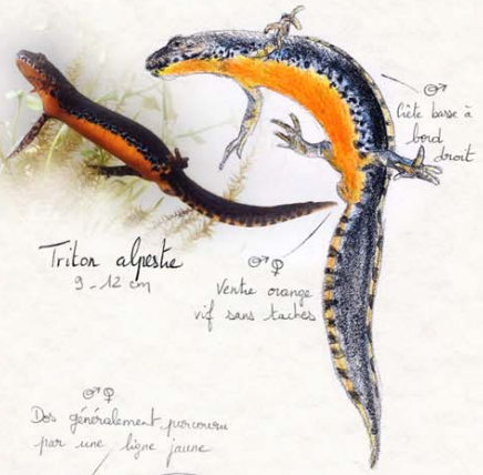
Triton alpestris 9 - 12 cm