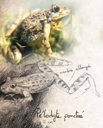
Pelodyte ponctué 5 cm

Face inférieure jaune vif ou orangée marbrée de gris - noir bleuté