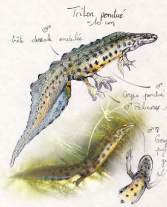
Triton pondus 10 cm

Des généralement pourvus par une ligne jaune