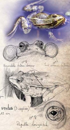
Grenouilles vertes (3 espèces) 8 - 15 cm