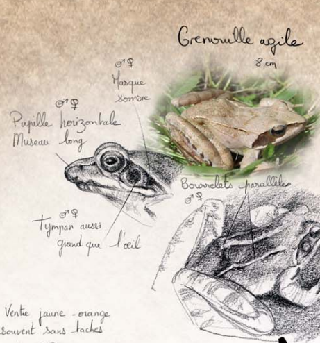
Grenouille agile 8 cm