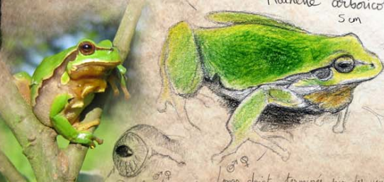
Rainette arboricole 5 cm

Tout le dessous vert vif uni et bandes noir sur les flancs