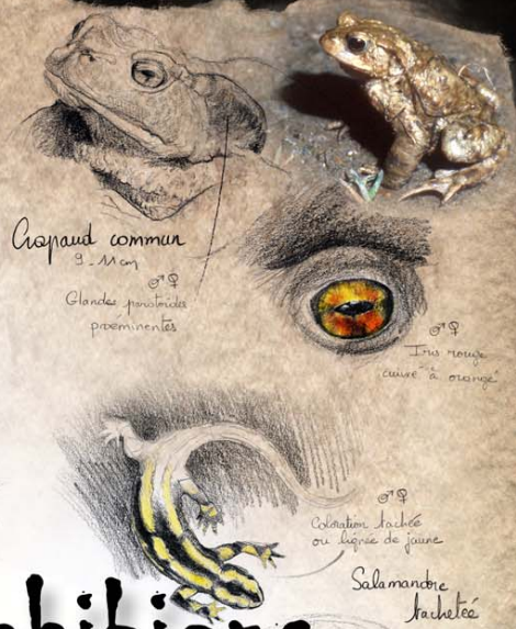
Crapaud commun 9 - 11 cm