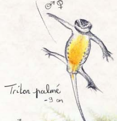
Triton palmé 9 cm

Ventre jaune - orange souvent sans taches